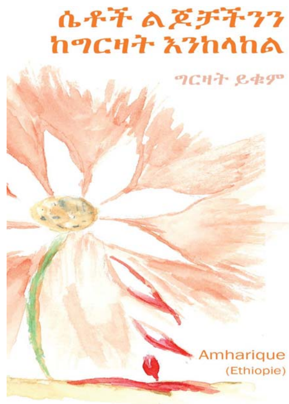
“Protégeons nos filles de l’excision, NON AUX MGF”: Brochure publiée dans le cadre du projet de Genève, en Amharique (Éthiopie) et autres langues pertinentes aux communautés ciblées)

L'OIM a adopté une approche globale et fondée sur les droits humains afin de relever les défis uniques découlant de la transposition des MGF dans les pays industrialisés. L'internationalisation des MGF nécessite une stratégie globale et intégrée visant l'éradication de la pratique qui comprend le renforcement des capacités, la mise en réseau et l'échange des bonnes pratiques. Pour