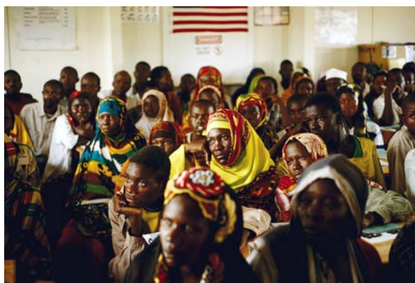
Réfugiés somaliens suivant un cours d'orientation culturelle au Kenya

Les MGF violent une série de principes, normes et standards de respect des droits humains: les principes d'égalité et de non-discrimination sur la base du sexe, le droit à la vie (lorsque la procédure entraîne la mort), le droit de ne pas être soumis à la torture ou à des peines ou traitements inhumains ou dégradants, le droit de jouir du meilleur état de santé, le droit à l'intégrité physique et les droits des enfants à des protections spéciales. La pratique persistante des mutilations génitales féminines constitue également un obstacle à la réalisation des Objectifs du Millénaire pour le développement (OMD), notamment le troisième (promouvoir l'égalité des sexes et l'autonomisation des femmes) et le cinquième (améliorer la santé maternelle).